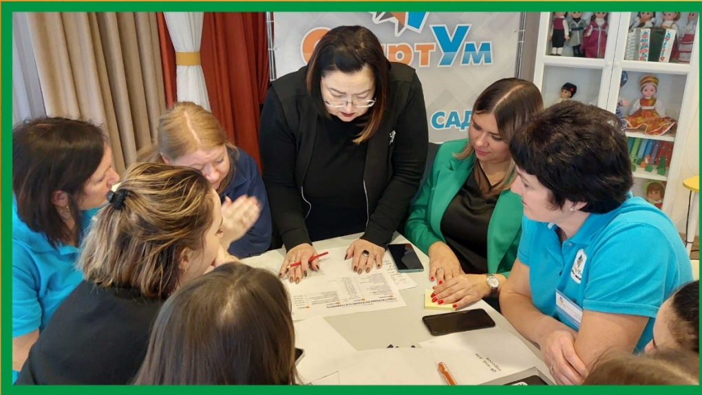
Заседание рабочей группы, разработка карт текущего и целевого состояния процесса, «дорожной карты» реализации проекта.