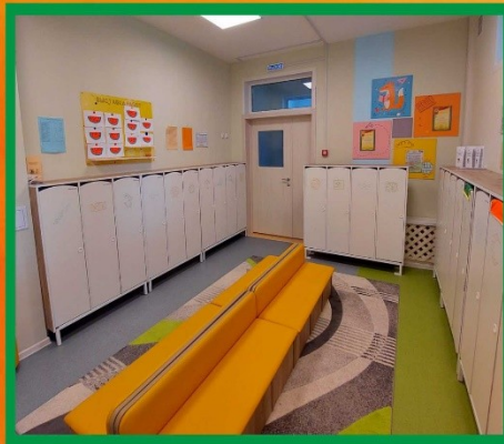
Перестановка мебели в приёмной

Внедрение улучшений: разработка алгоритмов (схем) расположения детской одежды в шкафу и последовательности одевания детей на прогулку