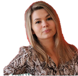
Старший воспитатель Член команды проекта